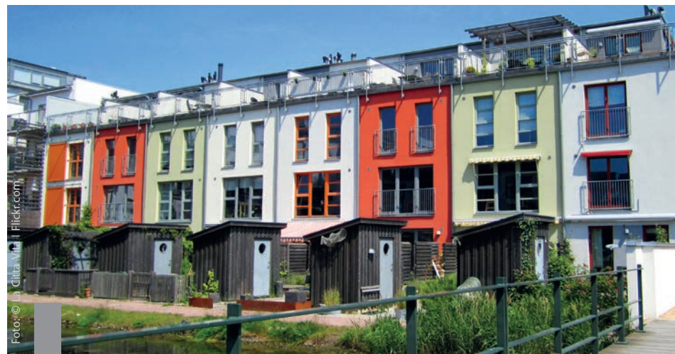
Nie war es leichter als jetzt, Wohneigentum zu bilden.

Die selbst genutzte Wohnimmobilie hat vor allem wegen der historisch niedrigen Zinsen deutlich an Attraktivität gewonnen. Während 2008 nur 43 Prozent der Wohnungen von Eigentümern bewohnt wurden, waren es 2010 bereits knapp 46 Prozent. Eine weitere Steigerung der Quote ist unter den aktuellen Rahmenbedingungen zu erwarten. Dabei ist die Entscheidung „mieten oder kaufen?“ weniger eine Frage des Geldes als der individuellen Einstellung und Lebenssituation. Das IW Köln hat untersucht, wo sich das Kaufen und Mieten besonders lohnt. Im Jahr 2009 war das Vermieten bzw. Mieten in 73 Prozent aller Landkreise die vorteilhaftere Wohnform, während lediglich in sieben Prozent das Kaufen lohnender war. 2013 war das Kaufen bereits in 27 Prozent und das Mieten in nur noch 22 Prozent aller Landkreise die günstigere Wahl. Auch das Institut für Städtebau geht von einer steigenden Eigentümerquote und einer steigenden Nachfrage aus. Überdurchschnittlich hohe Zuwächse bei der Wohnflächennachfrage werden vor allen in München, Berlin, Hamburg, Bonn und Stuttgart sowie in Teilen Brandenburgs im Speckgürtel um Berlin, in Nordniedersachsen, Bayern und Baden-Württemberg erwartet.