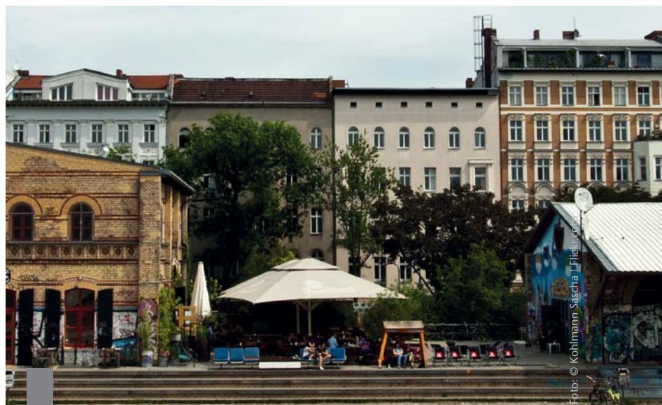
Der lange als entspannt geltende Wohnungsmarkt in Berlin gerät durch den anhaltenden Zuzug in die Hauptstadt zunehmend unter Druck.

Die Neuvertragsmieten für Wohnungen in Deutschland sind im vergangenen Jahr flächendeckend in allen Wohnwert- und Baualterklassen sowie in allen Städtegrößen gestiegen. Das ist das Ergebnis des IVD-Wohn-Preisspiegels 2013/2014. Die Angebotsmieten in München, Hamburg, Köln und Frankfurt sind laut Angebotspreisindex IMX im dritten Quartal 2013 dagegen erstmals seit mehr als einem Jahr leicht gesunken. Marktbeobachter bezeichnen die derzeitige Entwicklung als Seitwärtsbewegung und sehen sie als Indiz dafür, dass teilweise Preisobergrenzen erreicht wurden. Allerdings herrsche in den meisten Städten weiterhin ein Nachfrageüberhang. So lange sich diese Situation nicht ändert, sei mittelfristig ein weiterer Anstieg der Mieten zu erwarten. Die Folgen eines deutlichen Nachfrageüberhangs sind derzeit in Berlin zu beobachten. Dort sind die Neuvertragsmieten um 1,9 Prozent gestiegen. Berlin hatte jahrelang einen sehr entspannten Wohnungsmarkt. Durch den starken Zuzug in die Bundeshauptstadt hat sich die Situation dort inzwischen verschärft.