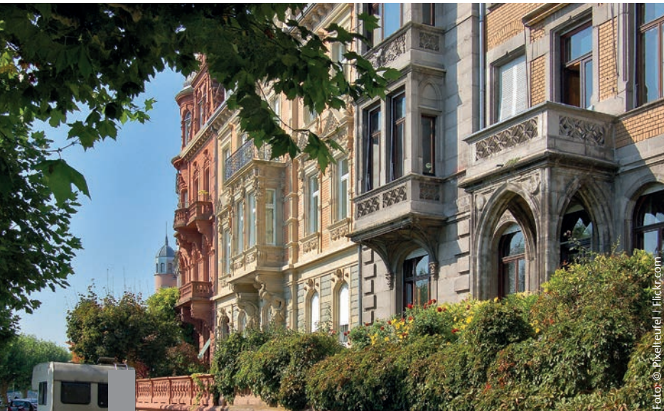
Mittelschicht Haushalte und junge Menschen zieht es in die beliebten Quartiere der Innenstädte, die als Ausdruck eines neuen, urbanen Lebensstils gelten.

Das Zusammenspiel von Angebot und Nachfrage auf dem Wohnungsmarkt stimmt in einigen Metropolen nicht mehr. Steigende Mieten und Wohnungsknappheit sind in vielen Großstädten die Folge. In den attraktiven Quartieren geht die mit Investitionen und einer Aufwertung von Wohnungsbeständen einher. Diese Entwicklung kann zur Verdrängung alteingesessener Bewohner durch zahlungskräftigere Bevölkerungsgruppen führen, und die Quartiere können an Vielfalt verlieren. „Aufwertung ist unerlässlich, um Städte zukunftsfähig zu gestalten. Dabei müssen allerdings sozialverträgliche Wege gefunden werden, so dass Aufwertung nicht zwangsläufig mit Verdrängung einhergeht und mit Luxussanierung gleichgesetzt wird“, sagt Harald Herrmann, der Direktor des BBSR. „Im Idealfall begleiten Stadtentwicklungs- und Wohnungspolitik die Aufwertung von Quartieren, so dass Verdrängung vermieden wird. Das erfordert Aufmerksamkeit, Mut und auch neue Lösungsansätze.“